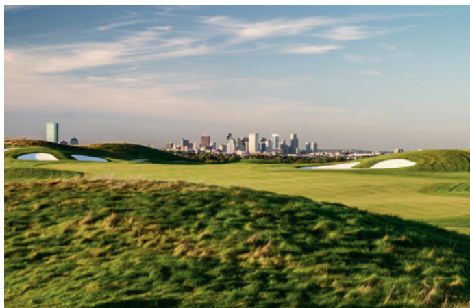
Boston in Sichtweite: The Granite Links. City in sight: The Granite Links.