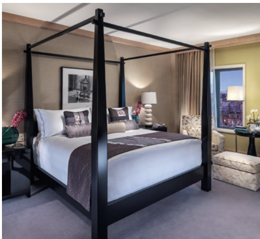
Erstklassig: The Mandarin Oriental, Boston. Top-class: the Mandarin Oriental, Boston.